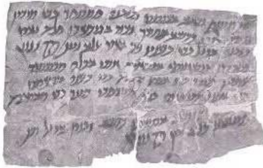
وینه ۵: یه کیک له قهباله چه رمه کانی هه ورامان که به نارامی کلاسیکی تومارکراوه (أحمد، ۱۹۸۸، وینه ۳۳).