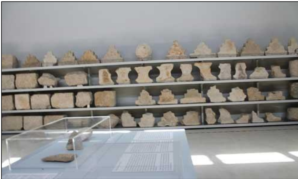
وېنه ۷: به رده كانى مؤنومىنتى په پىكولى له موزه خانه ي سليمانى.

ئەلفىيى ئەشكانى له سه رده مى ئەشكانىيە كان (۲۵۰ پ.ز. - ۲۲۴ ز.) له سه ر سكه ئەشكانىيە كان و هه ندىك نووسىنى شاهانه ي پاشايانى ئەشكانى و پاشايانى ساسانى به كار هيندراوه، ئەم ئەلفىيى له راسته وه بۆ چه پ بۆ نووسين به كار ده هيندرا، و له ۲۲ پيت پىك ده هات، نووسىنى ئەشكانى وه ك ئارامى پيته كانى وشه كان به جيا ده نووسران و له يه ك نه ده دران. نووسىنى په هله وى كه پيشى ده گوتريت پارسى / فارسى ناوه راست، يا خود پارسيك. ئەم نووسين و زمانه له سه رده مى ساسانىدا به فهرمى به كار هيندراوه. په هله وى يه كه م جوړى نووسينه كه پيتى وشه كانى پىكه وه نووسراون و به و شيوه يه ي كه ئىستا له نووسىنى كوردى و فارسى و عه ره بيدا به كار دىت. په هله وى وه ك زمان و وشه زور نزيكه له زمانى كوردىي ئەمرۆ، ته نانه ت به راورد به زمانى فارسى ئەمرۆ، زمانى كوردى نزيكتره له په هله وى. باشترين نمونه ي به كار هينانى نووسىنى ئەشكانى له تۆماره شاهانه كه ي پاشاى نارسه ي ساسانى له سالى ۲۹۳ ز. دا له په پىكولى له نزيك ده ره بنديخان كه له سه ر ده يان به رد به نووسىنى ئەشكانى و په هله وى تۆماركراون (مارف، ۲۰۱۸، ۱۳۷-۱۶۵، ئەحمه د، ۲۰۱۱، ۱۱-۳۶) (وېنه ۷).