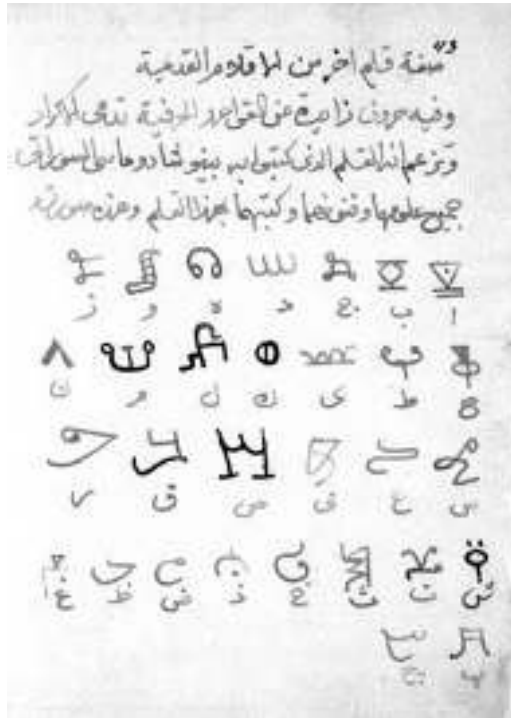
وێنە ۸: پیتەکانی ئەلفبێی کۆنە کوردییەکه‌ی که لەلایەن نەبەتییەوه باس کراوه، لە دەست‌نووسەکه‌ی "النبطي الکلداني، ۲۰۱۰" وەرگیراوه.

"تایبەتمەندی پینوووسیک (ئەلفبێیەکی) لە پینوووسە (ئەلفبێی) کۆنەکان، که تیندا چەند پیتیکی زیاتری تیدایە لە رێسا پیتییەکان، ئەم رێنوووسە پینی دەوتریت (ئەلفبێی) کوردەکان، دەگوتریت که ئەم پینوووسە (ئەلفبێی) ئەوه‌یه که بینو شادوماسی ئەلسوراتی هەموو زانستەکانیان و هونەرەکانیان و کتیبەکانیان بەم پینوووسە (ئەلفبێی) نووسیوه و ئەمەیی خوارەوه وێنەیه‌که لەو(ئەلفبێی). (النبطي الکلداني، ۲۰۱۰).