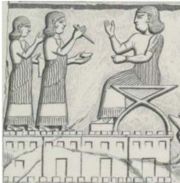
وینه ی ۳: دیمه نی تۆمارکردنی تالانییه کانی شاری موساسیر (ئه ردینی) له ناوچه ی برادۆست له لایهن دوو نووسه ری ئارامی و ئاشوری و وه زیریکی ئاشوریه وه (Botta & Flandin, 1972, pl.141).

ئەلفیبی ئارامی له رینگه ی بازرگانی وشکانی به زۆربهی ناوچه کانی خۆرهه لات و کیشوهه ری ئاسیادا بآلو بووهوه، و له رینگه ی بازرگانی ده ریا به وه ئەم ئەلفیبیه گه یشتنه یونان و ئەلفیبی گرێکی و پاشان ئەلفیبی لاتینی و ئەلفیبی لاتینییه کانی تری خۆراواش هه موویان له ئەلفیبی ئارامیه وه سه رچاوه یان گرتوه. ئەلفیبی ئارامی ته نگه ی به هه موو ئەلفیبیکانی تر هه لچنی و ئەمه جگه له وه ی که ورده ورده ته نگه ی به خه تی میخی هه لچنی و هه ر له ناوه راستی سه ده ی هه شته می پ. ز. هه له دیوانی کۆشکی پاشایانی ئاشوریدا جگه له نووسه ری خه تی میخی و شیوه زاری ئاشوری، له ته نیشتیه وه نووسه ریکی خه تی و زمانی ئارامی له سهه ر بیسته فه رمانه شاهانه کانیان تۆمارده کردن (وینه ی 3). جیی ئاماژه به ئارامیه کان له قاتوقریه که ی سالی ۱۱۴ پ. ز. له سوریا وه هیرشیا ن کرده سه ر ناوچه کانی خۆراوا و باشوری کوردستان و به ده شتی هه ولیردا هه تا ده شتی کویه هاتن و به شیکیان له ده شتی بتوین و ده وره به ری نیشته جی بوون، دواتریش پاشایانی ئاشوری به هه زاران ئارامییان بۆ ناوچه کانی رواندز و ناوچه ی ولاتی زاموا له سلیمانی و ده وره به ری راگواست، به و شیوه یه وه ک که مینه یه ک له زاگرووسدا نیشته جی بوون (بۆ زانیاری زیاتر ده رواندریته توێژینه وه یه کی تایه تمان 78-91, Marf 2019).