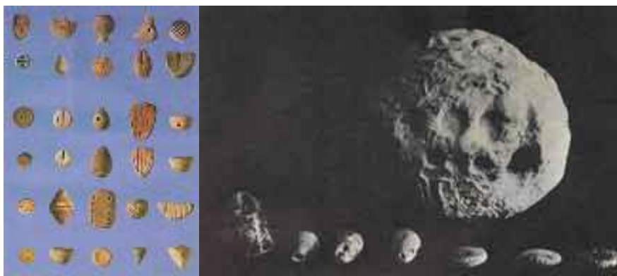
وینه ی ۲: دیمه نی توپه قور و ئەو هیمما قورینه ی پینان نووسین به کار هیندراون (Schmandt-Besserat, 1977).

ناوبندرین، به ئینگلیزی شوئنهوارناسان پینان ده لاین (tokens) و ئەم هیمایانه له کاتی مامه له و بازرگانیدا به تاییهت له کاتی قهرز پیدان و بردنی کالاً بۆ فروشتن به پیی جۆر و ژماره ی کالاکه هیماکان دروست ده کران، بۆ نمونه په بیکه ره هیمما بچوکه که کان به پیی جۆری کالاً بازرگانیه که دروست ده کران ئەگه بازرگانی به ئاژه له کانه وه بکرایه ئەوه شیوه ی سه ری گامیش هیمما بوو بۆ گامیش، بازنه یه ک هیممای دوو هیللی یه کتر بری تیدا بیت هیممایه بۆ مه ر، گۆزه یه ک ئاماژه یه بۆ ئەو خواردنه وه یه ی که تیدایه، ههروه ها هیممای قاپیک ئاماژه یه بۆ پیدانی خواردن به کریکاران له کارگه کانی رستن و چینی یان له به نده ر و بنکه بازرگانیه کاند، به و شیوه یه چه ند گۆزه یه ک له دانه وێله و رۆن و خواردنه وه له سه ر شیوه ی گۆزه ی بچووک به قور یان به رد دروست ده کران به پیی ئەو ژماره یه ی که مامه له ی پیه ده کرا، پاشان هیمماکان ده خرا نه ناو توپه له قور یکی ناوبۆشه وه که به ئینگلیزی ناو نزاوه (bulla) توپه قوره که له هه موو لایه که وه داده خرا، پاشان به مۆری لوله یی هه موو لایه کانی مۆر ده کرا، توپه قور یکی تری هاوشیوه به هه مان جۆر و ژماره ی کالاکه دروست ده کرا و مۆر ده کرا (بۆ زانیاری ده رواند ریته ۵. 17ff, Marf 2019, 5-6; Schmandt-Besserat, 1992, p. 17ff. ۵), (وینه ی ۲).